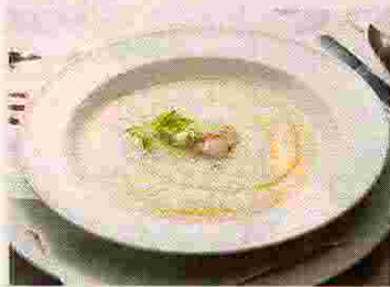
Die Vorspeise: Schaumsuppe mit Jakobsmuschel