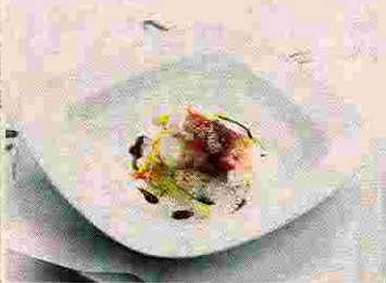
Der Zwischengang: Saltimbocca vom Kabeljau mit Kürbisrisotto