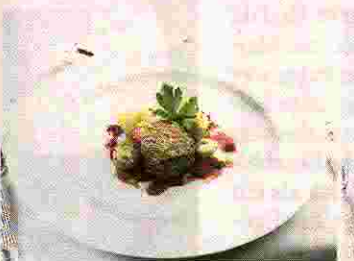
Der Hauptgang: Hirschrückenmedaillon mit Maronenkruste