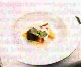
Das Dessert: Schokomousse mit Orangen und Amarettiparfait